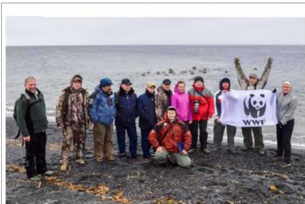
Делегация WWF на острове Вайгач (лежбище моржей в ООПТ) во время агитвизита по созданию национального парка 25.06.2016 года